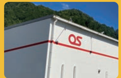
オーエスグループの工場（兵庫県）

オーエスグループは、1953年に映画館のスクリーン製造から創業しました。現在では国内外に8社のグループを擁し、「遠隔」「自動化」「エコ」といったキーワードに対し、IoT、AI技術を融合したものづくりを進めています。70年以上に及ぶものづくりのノウハウを次の世代に伝授することをメーカーの責務と考え、ものづくり塾も運営しております。